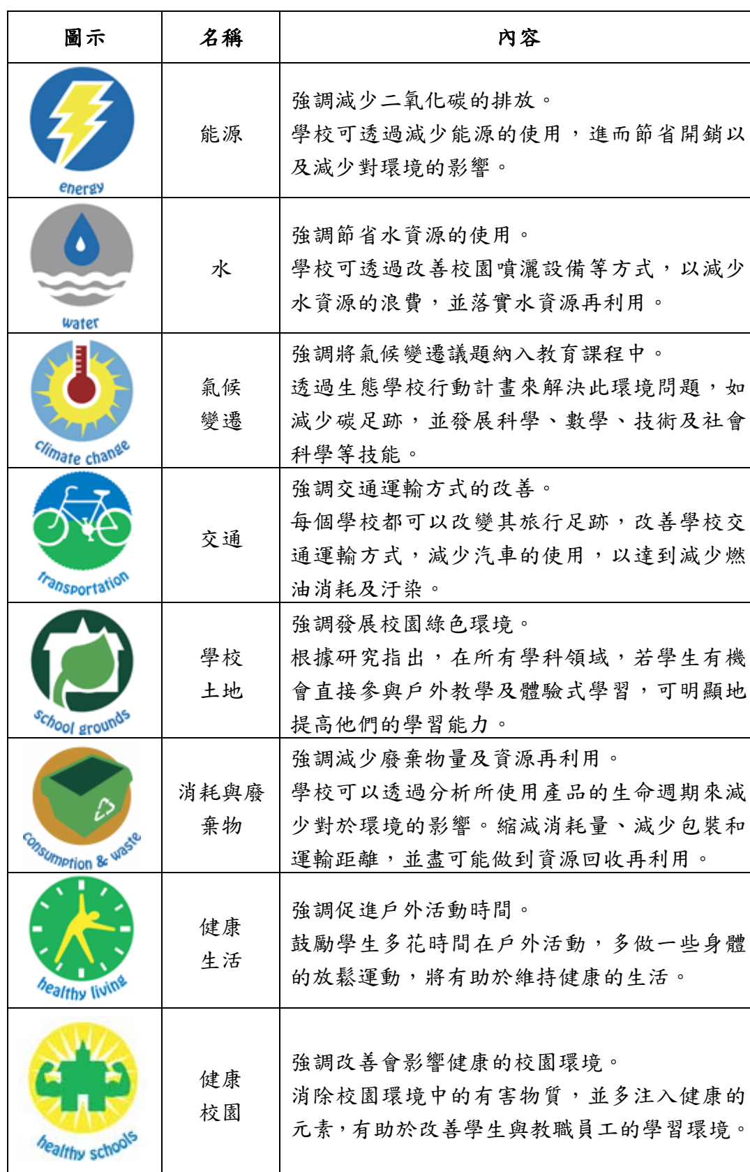
附表 1 環境路徑