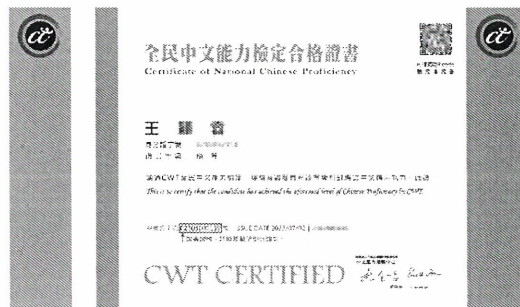
※高、優等證書證號示意圖